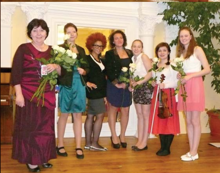
Koncert ubytovaných studentek v roce 2014