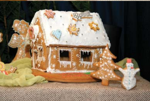
Pečení perníkového betléma je oblíbenou adventní aktivitou.