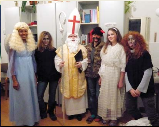
Mikulášská nadílka v roce 2007