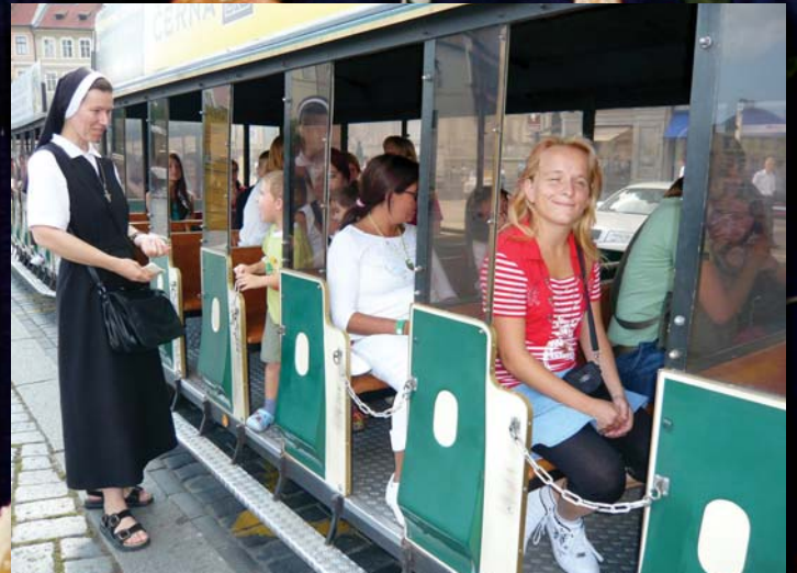
Výlet turistickým vláčkem po Praze v roce 2008