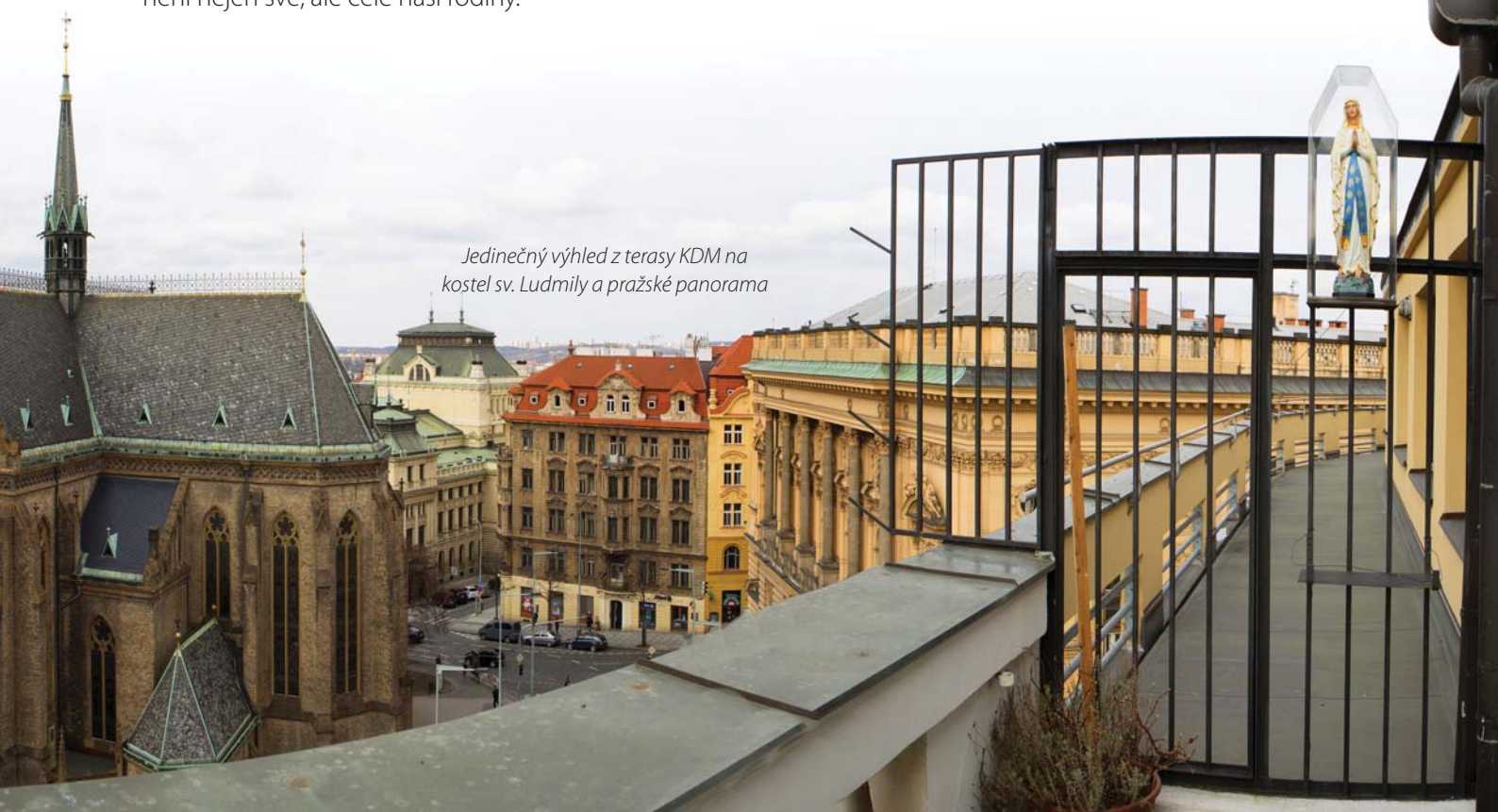
Jedinečný výhled z terasy KDM na kostel sv. Ludmily a pražské panorama