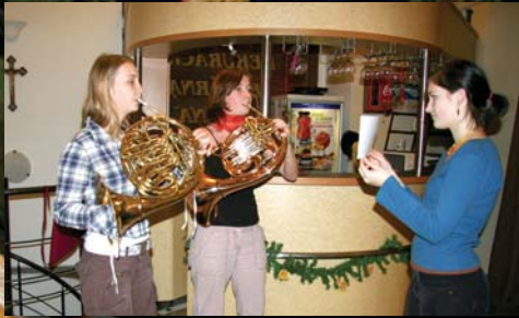
Hudební vystoupení dívek na vánoční večeři 2008