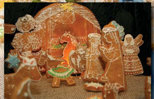
Perníkový betlém z roku 2012