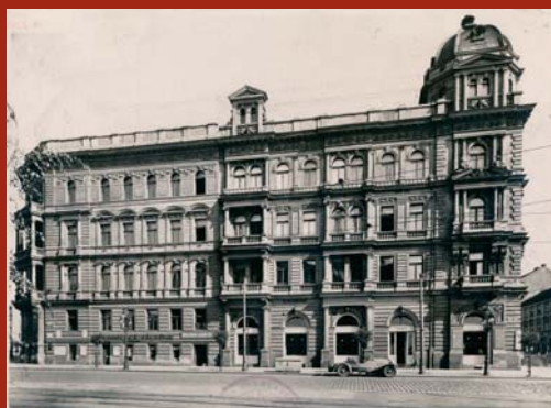
Budova dnešního KDM v roce 1936